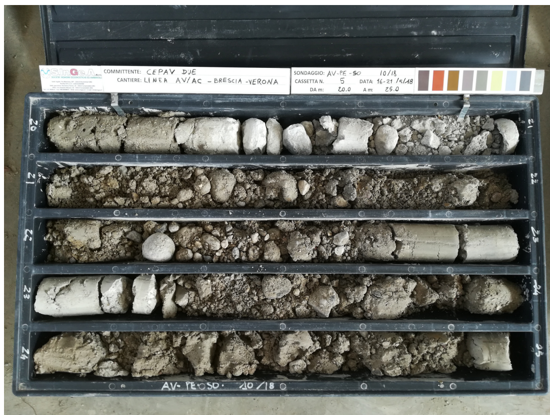
SONDAGGIO AV-PE-SO-10/18 - Cassa n.5 da 20.00 m a 25.00 m