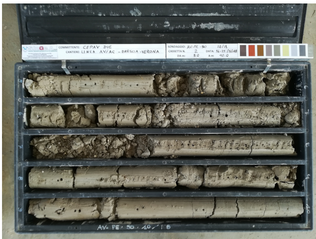
SONDAGGIO AV-PE-SO-10/18 – Cassa n.2 da 5.00 m a 10.00 m