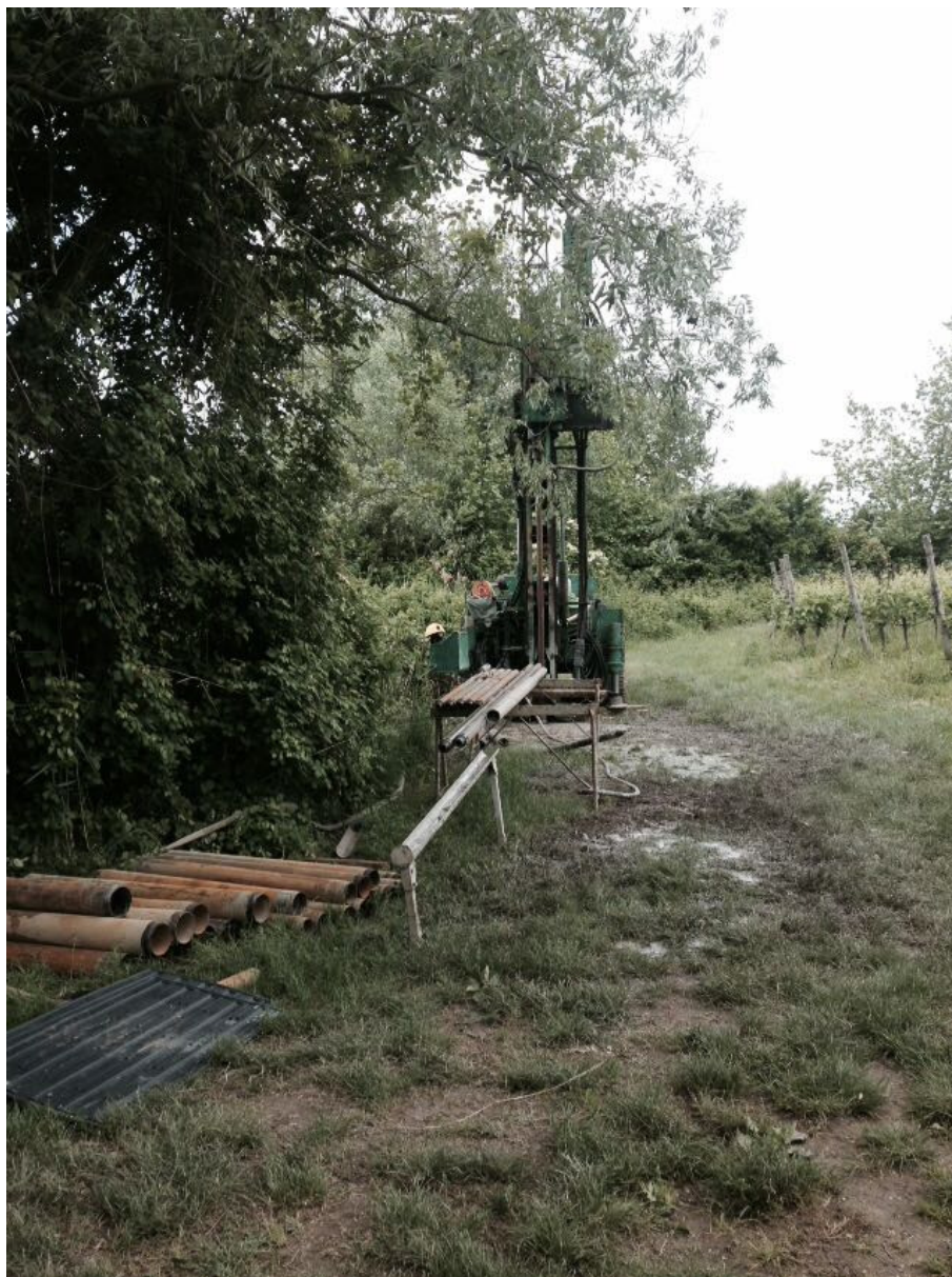
SONDAGGIO AV-PE-SO-10/18 – Postazione