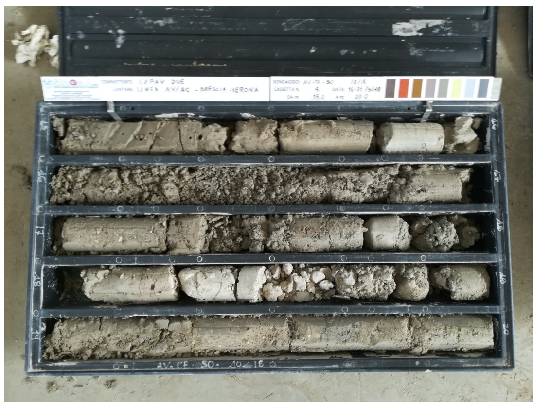
SONDAGGIO AV-PE-SO-10/18 – Cassa n.4 da 15.00 m a 20.00 m