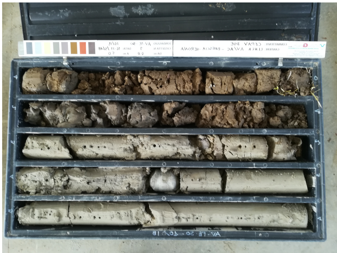
SONDAGGIO AV-PE-SO-10/18 – Cassa n.1 da 0.00 m a 5.00 m