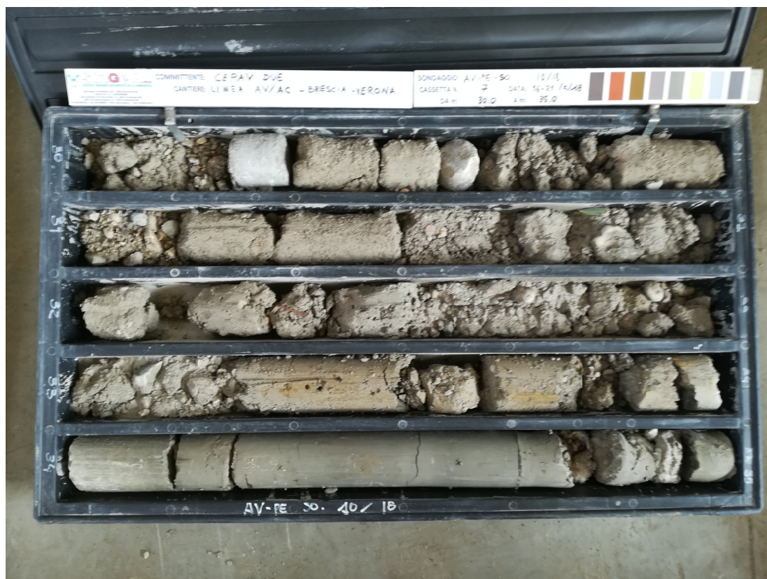
SONDAGGIO AV-PE-SO-10/18 – Cassa n.7 da 30.00 m a 35.00 m