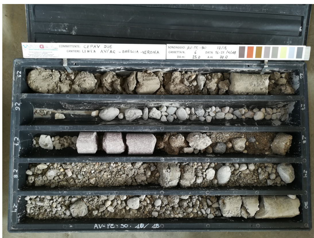
SONDAGGIO AV-PE-SO-10/18 - Cassa n.6 da 25.00 m a 30.00 m